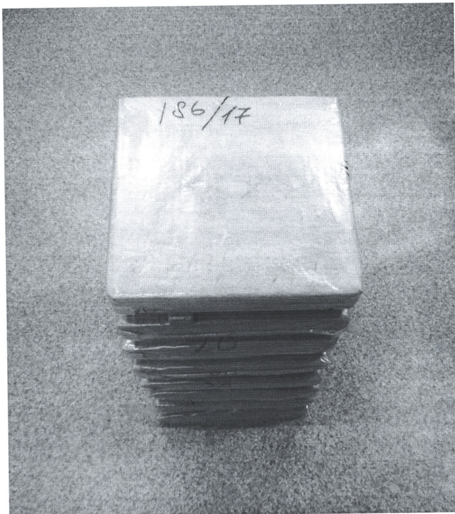
Рисунок 2 – Випробувальні зразки дослідів